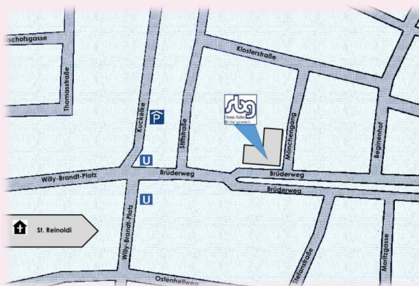
V.i.S.d.P.: R. Schmeltzer-Urban, SBG-Zentralausschuss e.V., Brüderweg 10-12, 44135 Dortmund

Ab Hauptbahnhof mit der U41/U45 bis „Kampstraße“, anschließend mit der U43/U44 bis „Reinoldikirche“.